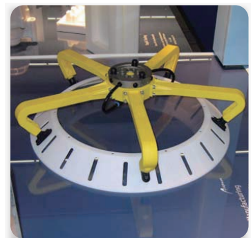
FORTUS / ABS樹脂のロボット グリッパー（黄色のアーム部品） 大きな円錐状の部品を吸引搬送。