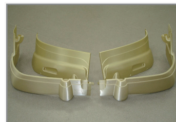
造形された計器パネルカバーの4部品