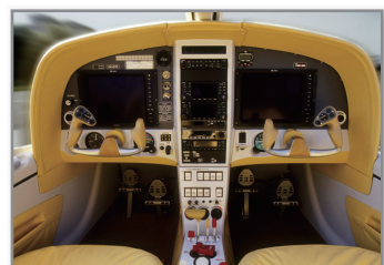
FORTUS 900mcにより造形され、仕上げた後直接VUT100に装着された計器パネルカバー